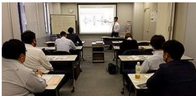
東京都支所・研修会

査定士証の有効期限が切れていても再度検定試験に受験する必要はありません。ただし、更新する場合には協会所定の研修会を受ける必要があります。