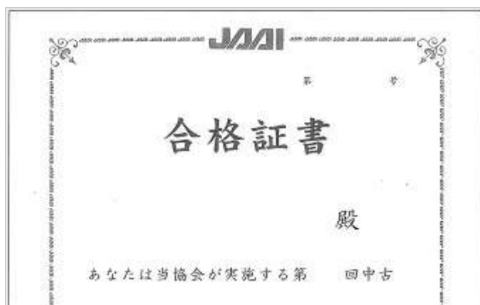
« 合格証書・見本 »

査定士技能検定に合格した記録は終身有効となります。しかし、合格証書を紛失した場合の再発行はできませんのでご注意ください。