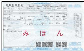
ICタグ付き自動車検査証